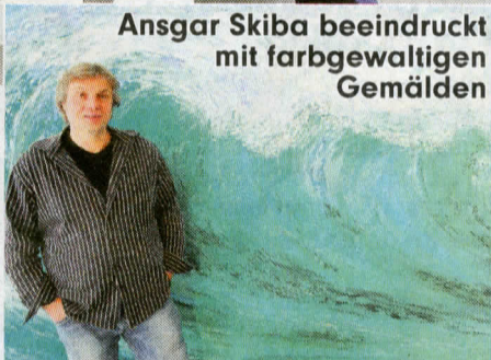
Ansgar Skiba beeindruckt mit farbgewaltigen Gemälden

Die polnische Künstlerin Agata Agatowski (35), die im vergange-